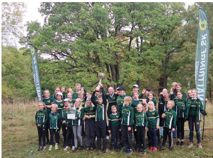
Snättringe SK vann Ungdomsserien 2022 Här är delar av laget på bild efter finalen i Skarpnäck.