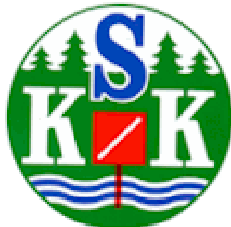
Stockholms Skogskarlarars klubb