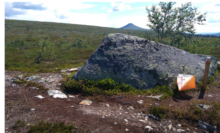
SM Ultralång avgjordes i år i fjällmiljö. Idrefjällens OK arrangerade den 25 juni.

Aumo, Göteborg-Majorna OK, 35.58, 13) Elsa Sonesson, Falköpings AIK OK, 43.57, 21) Ebba Thern, OK Skogshjortarna, 50.59.