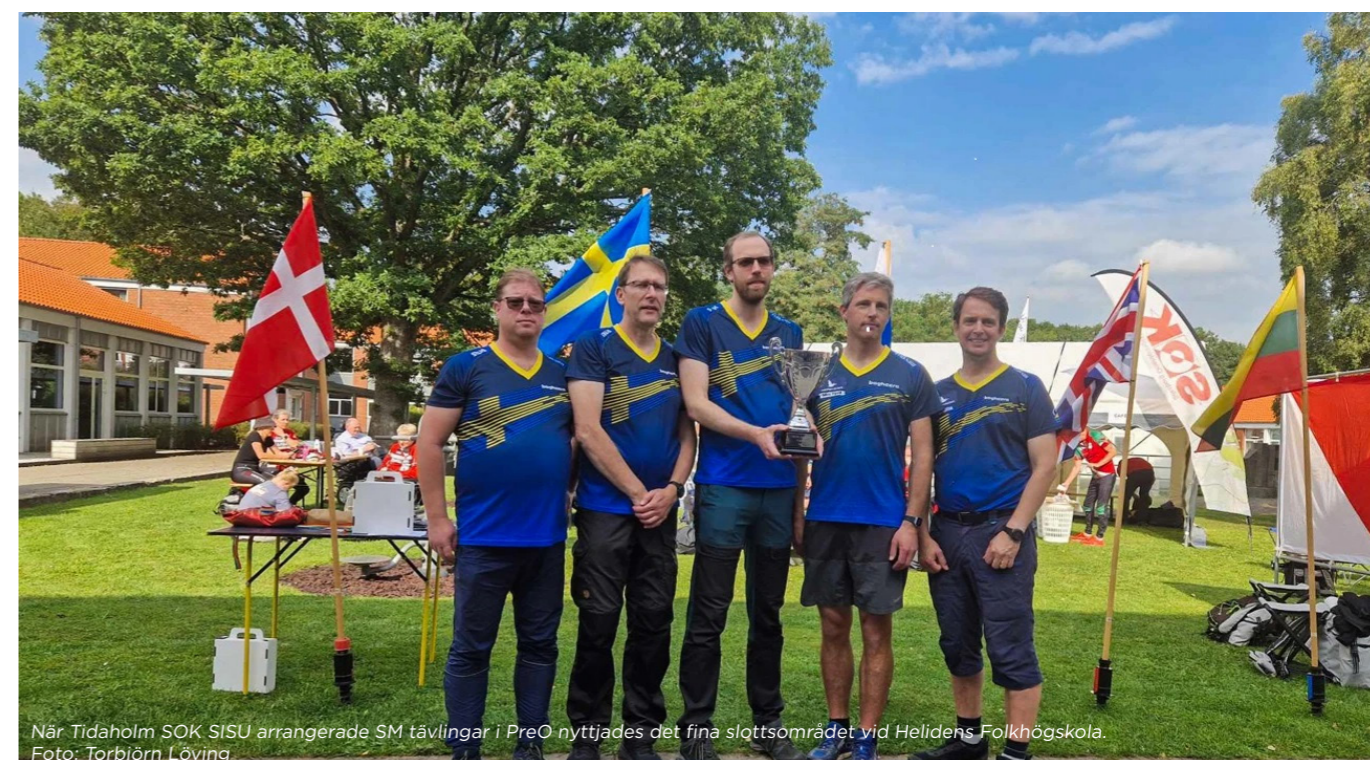
När Tidaholm SOK SISU arrangerade SM tävlingar i PreO nyttjades det fina slottsområdet vid Helidens Folkhögskola.