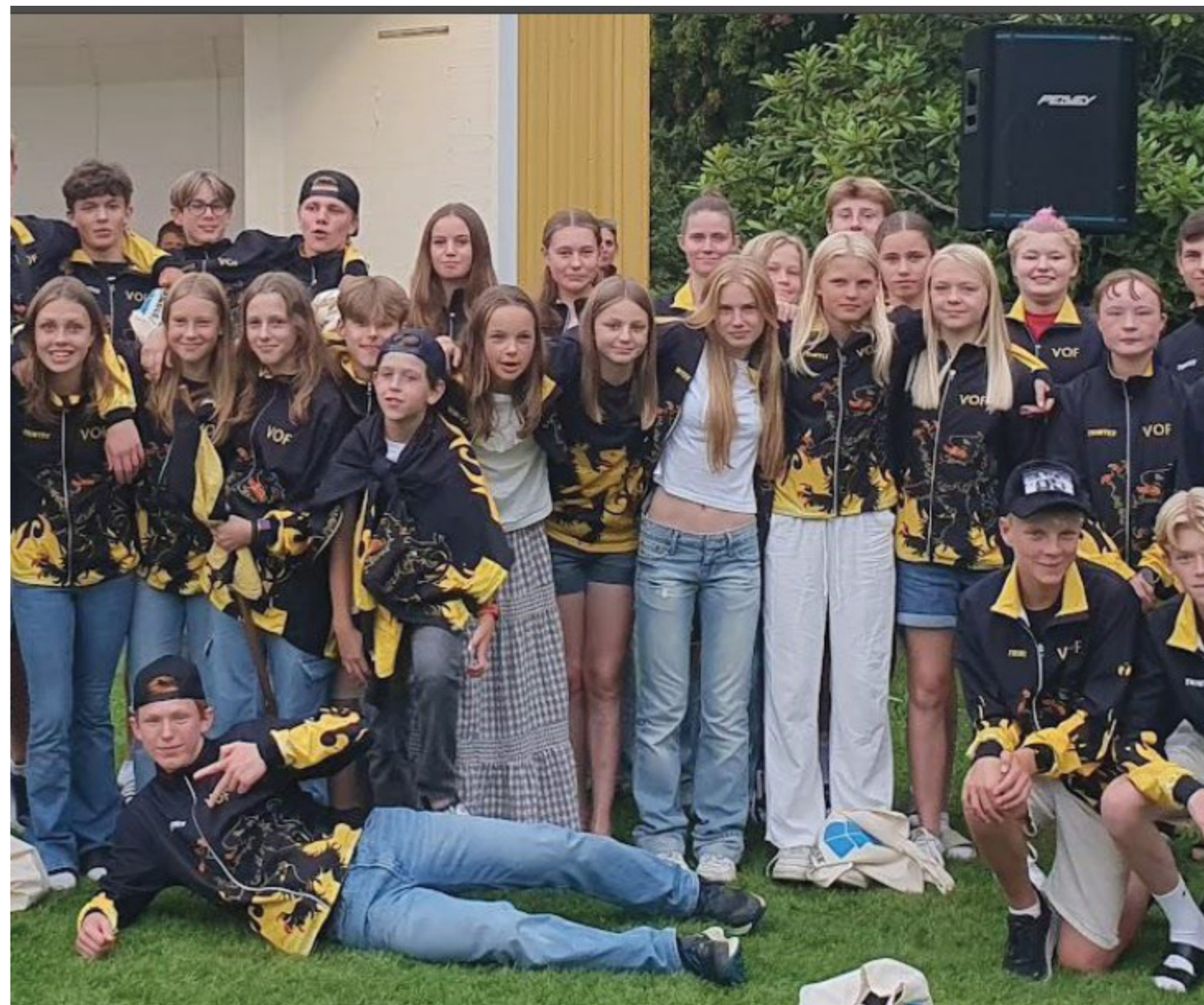
Västgötatruppen 2023